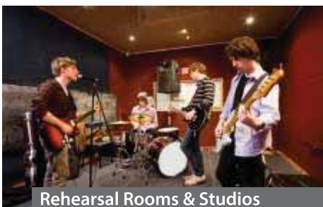
Rehearsal Rooms & Studios

myMix CONTROL, die Web-Browser gestützte Software vervollständigt das System. Sie erlaubt sämtliche Daten schnell und bequem zu speichern und wieder zu laden, sowie IEX16 und myMix zu konfigurieren und zu editieren. myMix CONTROL ist unabhängig vom Betriebssystem des Computers, und kann sowohl kabelgebunden als auch drahtlos verwendet werden. Das Netzwerkinterface myMix PLUG verfügt über internen Speicher, so sind alle Informationen immer im System verfügbar.