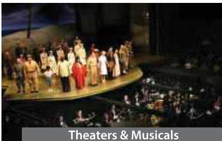
Theaters & Musicals