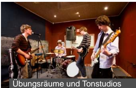
Übungsräume und Tonstudios

myMix CONTROL, die Web-Browser gestützte Software vervollständigt das System. Sie erlaubt sämtliche Daten schnell und bequem zu speichern und wieder zu laden, sowie IEX16 und myMix zu konfigurieren und zu editieren. myMix CONTROL ist unabhängig vom Betriebssystem des Computers, und kann sowohl kabelgebunden als auch drahtlos verwendet werden. Das Netzwerkinterface myMix PLUG verfügt über internen Speicher, so sind alle Informationen immer im System verfügbar.