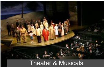
Theater & Musicals